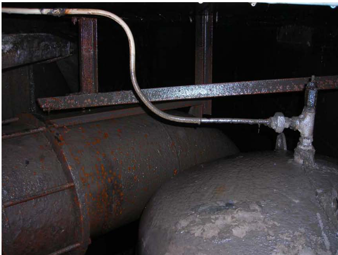
Fotografia 03 – Camera di manovra