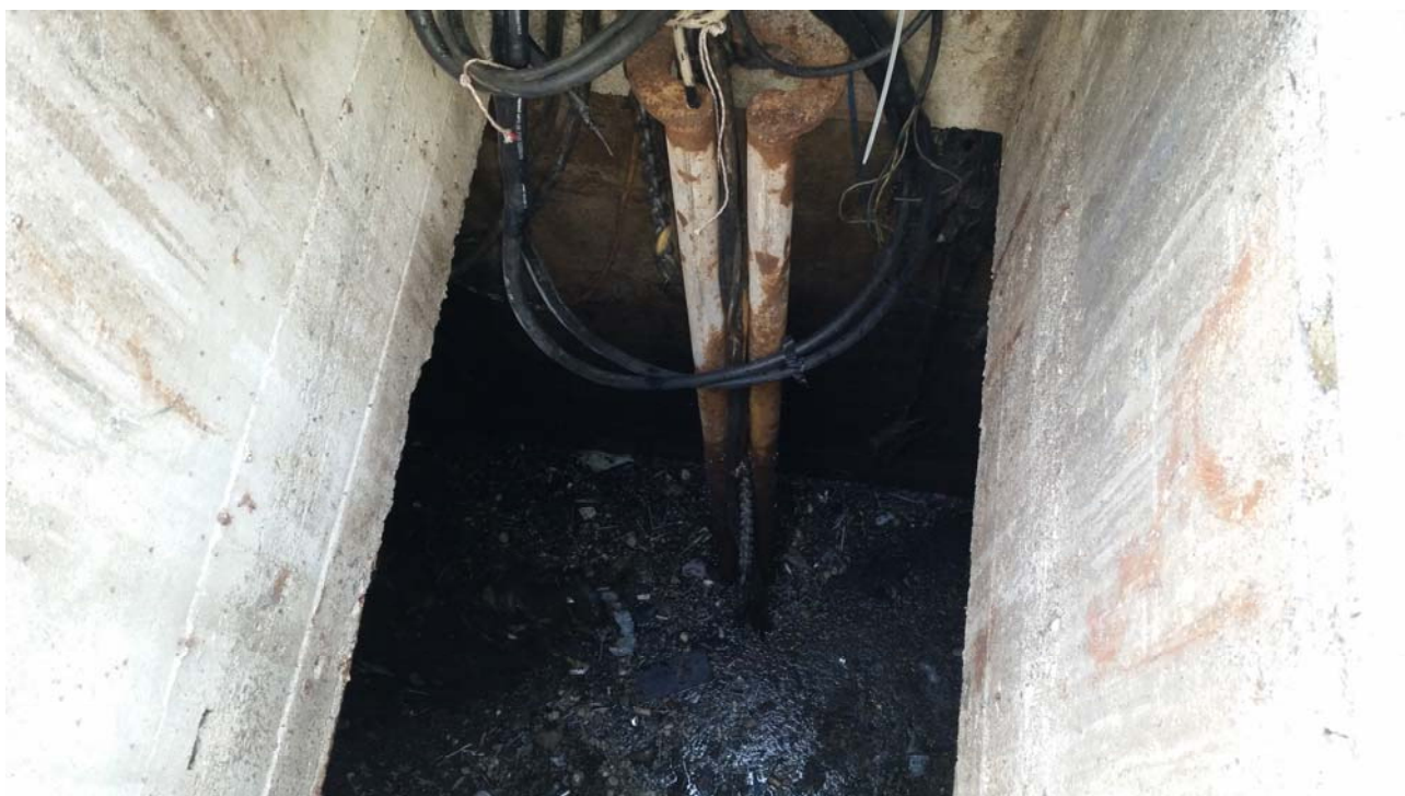
Fotografia 02 – Vasca alloggiamento delle pompe