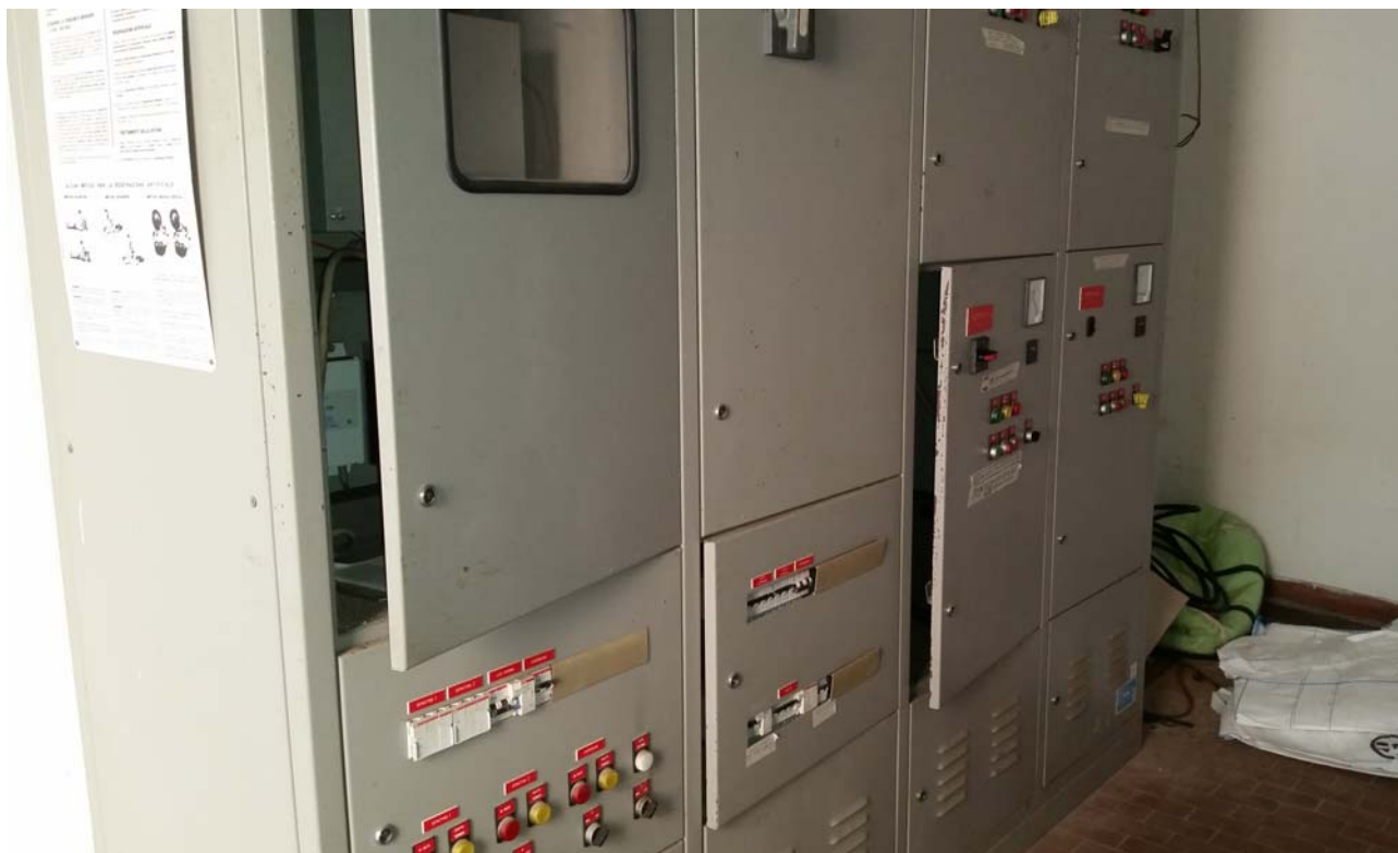
Fotografia 06 – Quadri elettrici