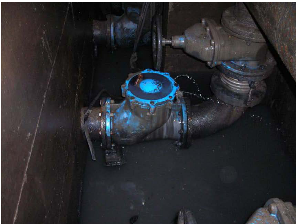
Fotografia 04 – Camera di manovra