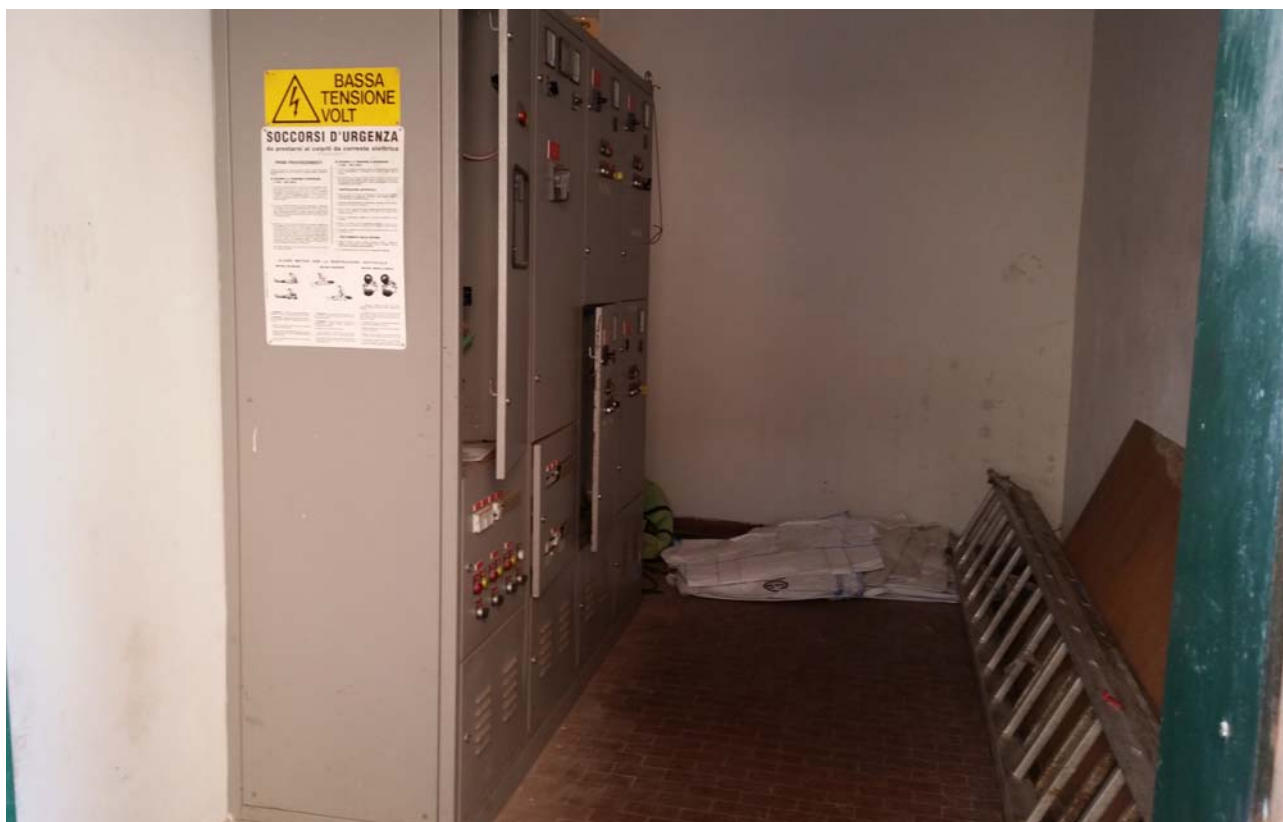
Fotografia 05 – Quadri elettrici