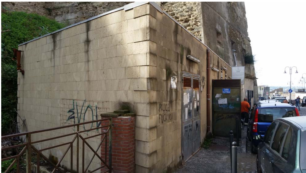
Fotografia 01 – Vista esterna

Nel presente paragrafo si riportano alcune fotografie relative all'impianto nei punti più significativi dell'impianto di sollevamento di Via Cavour .